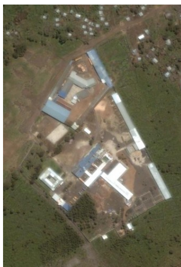
Centre Ngangi, Goma Latitude : 1°38'41.88"S Longitude : 29°13'55.77"E

Pour atteindre ses objectifs, ENERGY ASSISTANCE a besoin du soutien de ses MEMBRES .