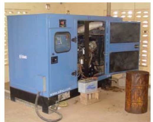
Groupe électrogène 80 kVA à Barsalogho

Pour améliorer les conditions de vie des villageois et développer de nouvelles activités économiques, pourquoi ne pas tenter une électrification légère (220 V - 2 A par raccordement) du village de Barsalogho, comptant 15000 habitants ? Un projet pilote est lancé en 2003 avec les 14 premiers abonnés. En juillet 2006, 123 raccordements sont réalisés avec un réseau 220 V de 1892 m. Lors de la mission de André et Marc en mars 2007, il y a 135 abonnés pour un réseau de 3008 m. C'est un groupe électrogène de 80 kVA