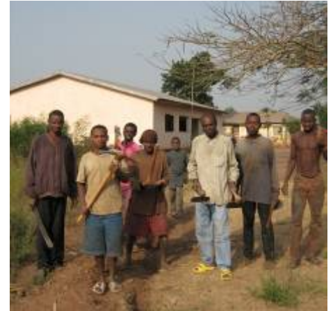
De lokale vrijwilligers

zien geraamd wordt dat de opbrengst van deze activiteiten de kosten van de stookolie zullen dekken. Wat Aquassistance betreft, duurt het proces langer en er zal een extra verkenningsmissie vereist zijn om de capaciteit te testen van de bestaande put en de drinkfontein op te sporen. De uitvoeringswerkzaamheden zullen uiteindelijk begin 2008 samenvallen.