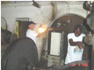
Guy slooft zich uit ....