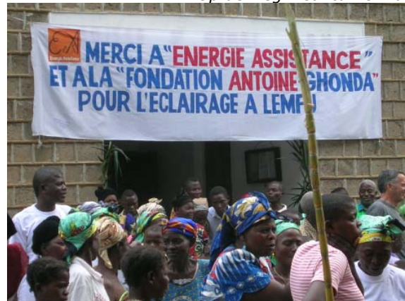
Dank aan EA