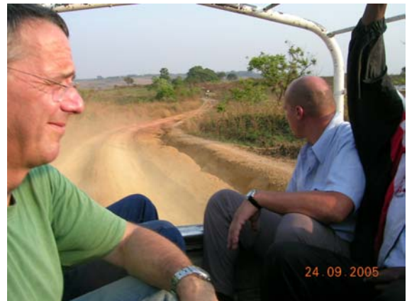
Op de weg Kisantu-Lemfu