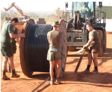
Het belgisch leger aan het werk